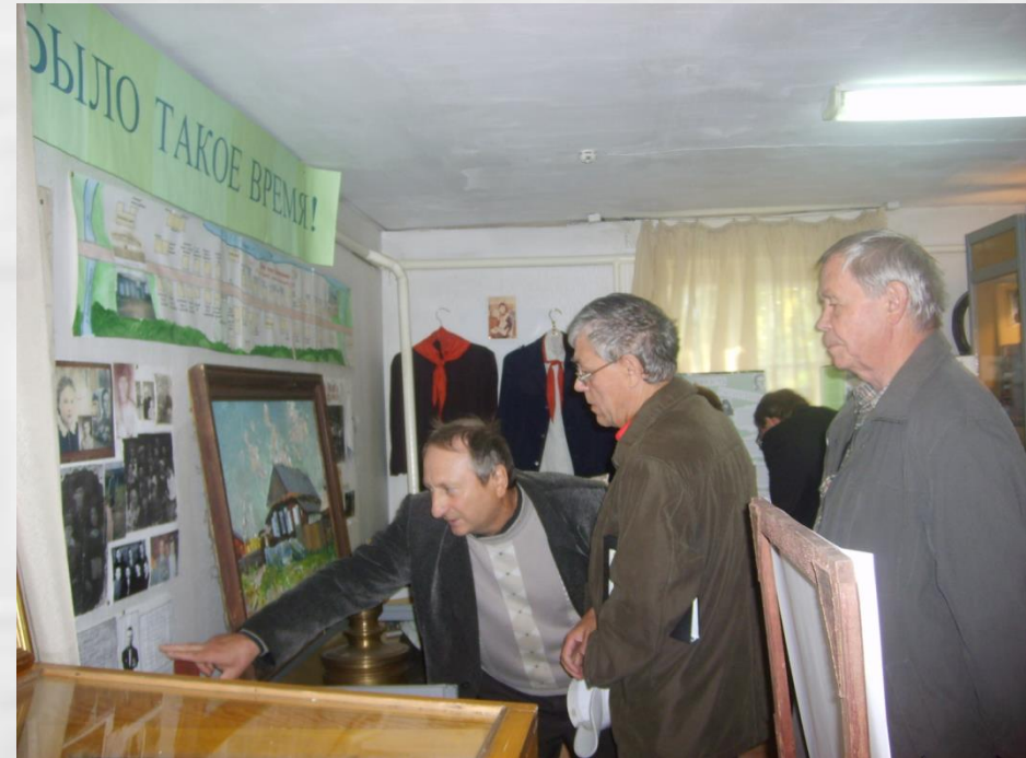
В Усть-Удинском районном краеведческом музее